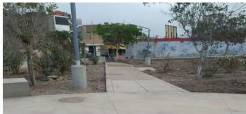
PARQUE N°1 DE LA ASOCIACION DE VIVIENDA EL HARAS DE CHILLON (EN EJECUCIÓN)