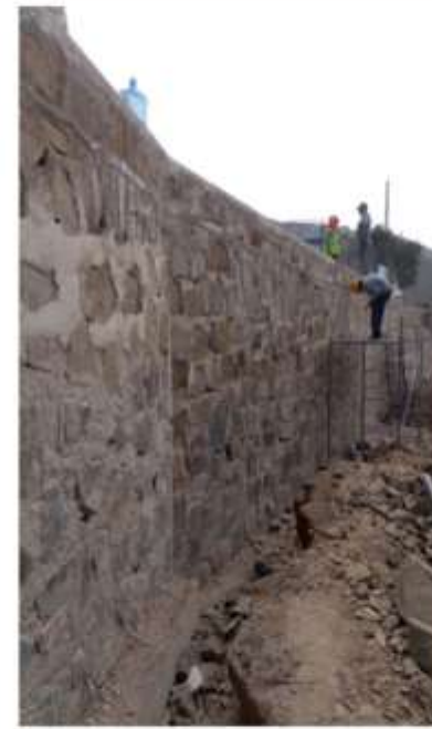
CA. 1 Y PJE. F DE LA MZ. Q AMPLIACION PUEBLO JOVEN LADERAS DE CHILLON - I EXPLANADA