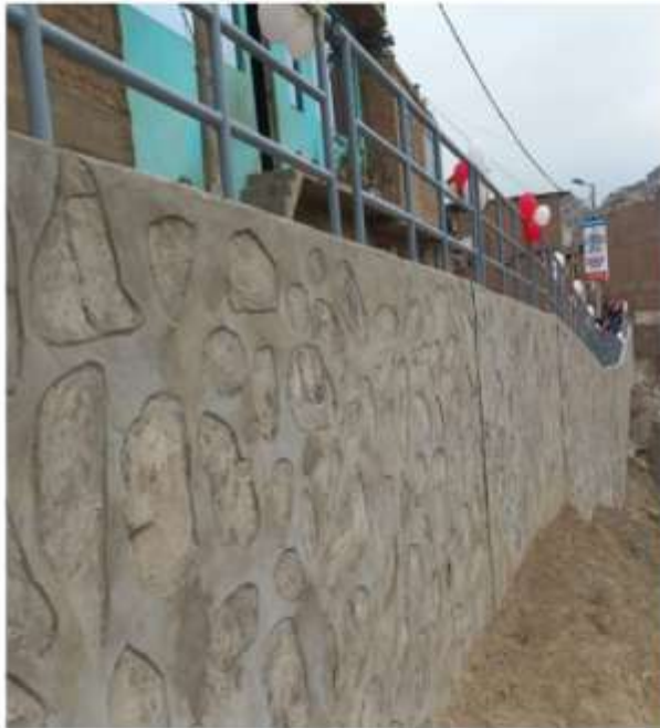
JR. APURIMAC. MZ 79B LOTE11 DEL AA.HH. SANTA ROSA COMITE 12