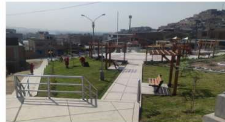
PARQUE DE LA MZ. 22 LOTE 2 DEL A.H. LA ALBORADA II ETAPA - SECTOR LEONCIO PRADO