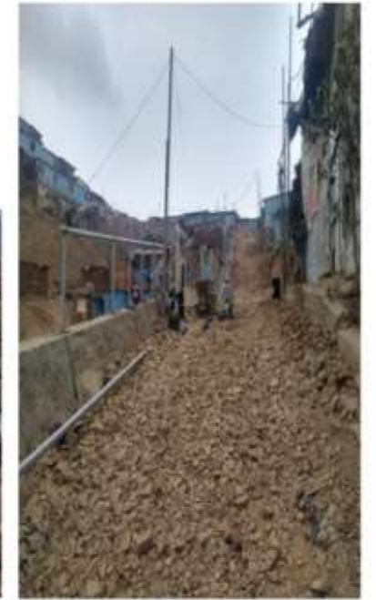
CA. 1, PSJE 2, PSJE 3 DEL ASENT. HUMANO NUEVO AMANECER - LEONCIO PRADO