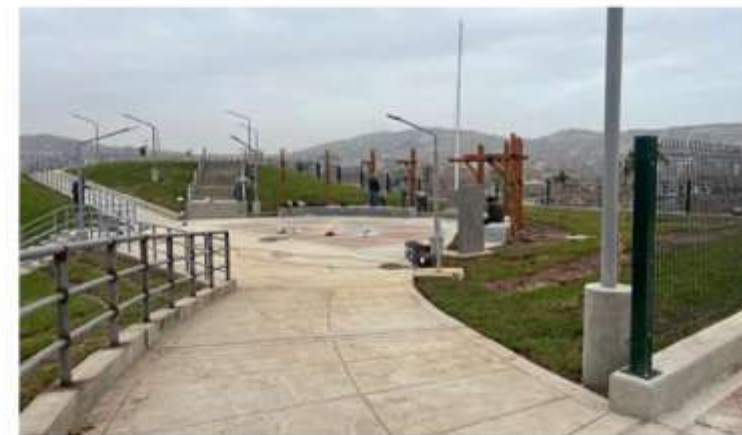
PARQUE DE LA MZ. Ñ LOTE 1 DEL A.H. TRES DE MARZO LAS ARENITAS - SECTOR JERUSALEM