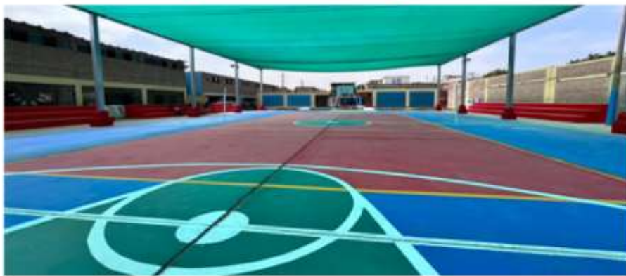
I.E. N 5168 ROSA LUZ - SECTOR TAMBO INGA OESTE