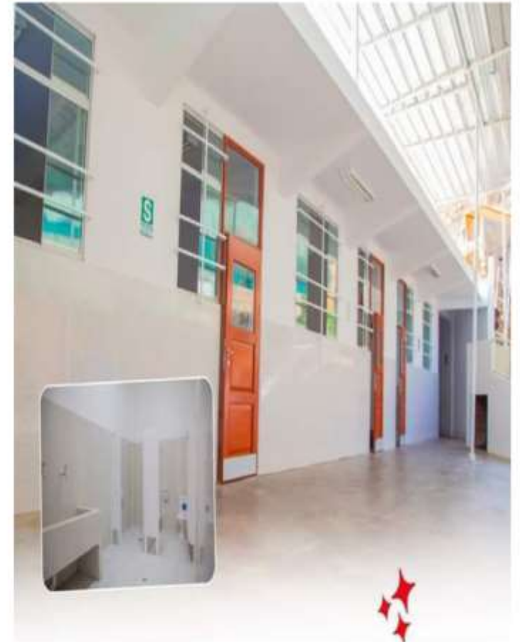
I.E. N° 332 AAHH SANTA ROSA – SECTOR SANTA ROSA