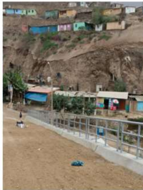
CALLE 23 DE SETIEMBRE DEL ASENT. HUMANO SANTA ROSA - ZAPALLAL