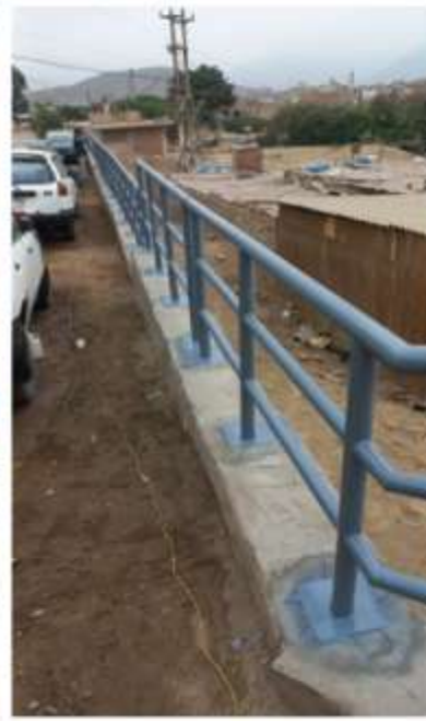
MZ. A DEL ASENTAMIENTO HUMANO LOS CANTEÑOS - ENSENADA