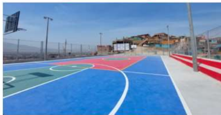
SERVICIO DEPORTIVO MZ K CENTRO POBLADO CERRO CAJAMARCA - SECTOR GRAMA