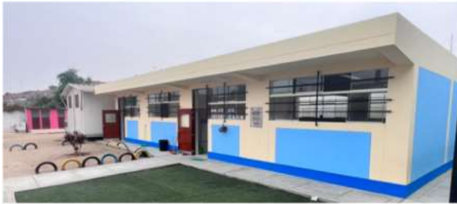
I.E.I. N° 586 EL DORADO - SECTOR EL DORADO

COSTO DE INVERSIÓN TOTAL S/ 1,493,291.00