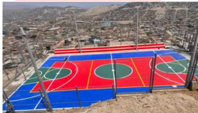
PARQUE DE LA MZ. G LT. 1 DEL A.H. SEÑOR DE MURUHUAY II ETAPA - SECTOR JERUSALEM