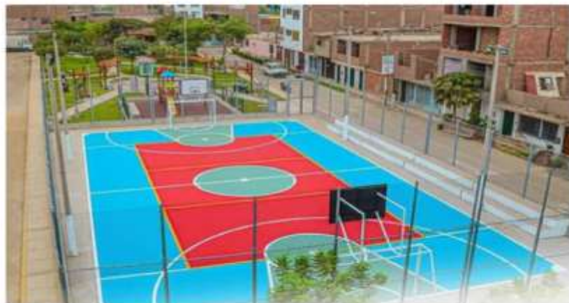
PARQUE MZ. F LT.1 DE LA URBANIZACIÓN VIRGEN DE CHAPI - SECTOR GALLINAZOS