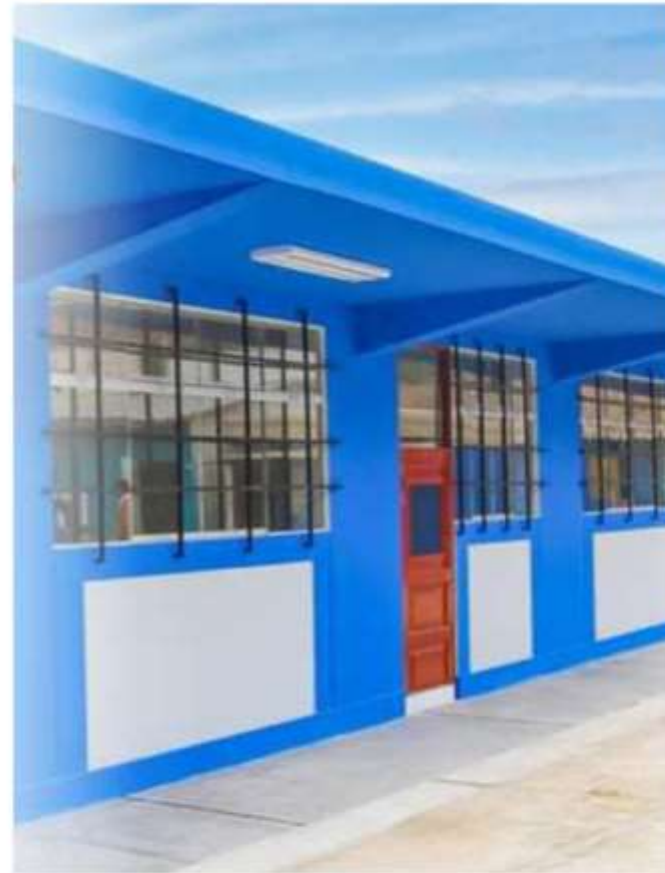
I.E. N°5180 ABRAHAM VALDELOMAR – SECTOR LADERAS