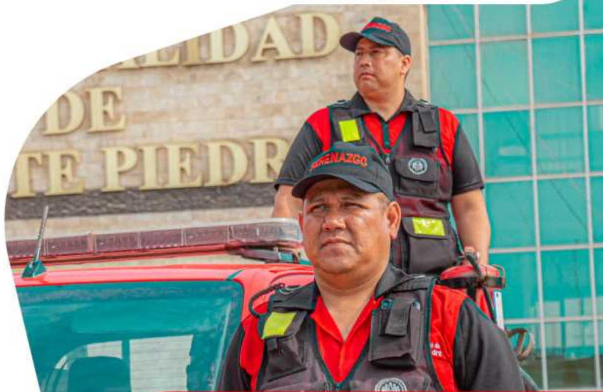
Rennán Espinoza Alcalde de Puente Piedra